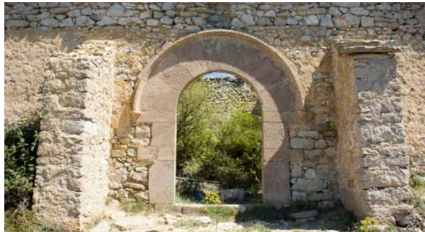
Ermita de Sant Cristòfol